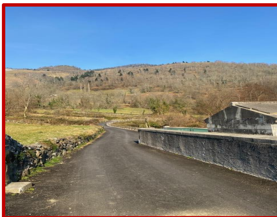
Réfection Chemin Darrè Salies.